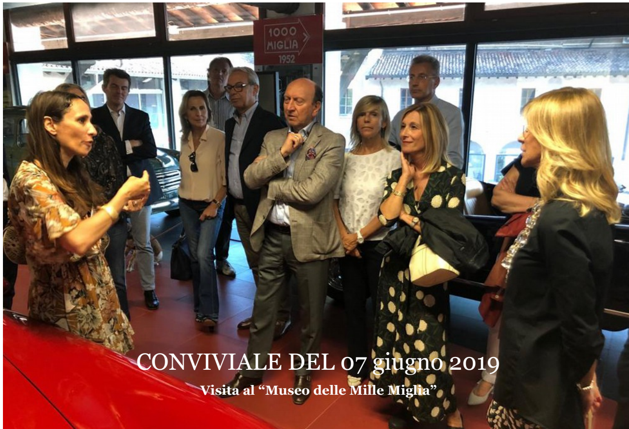
CONVIVIALE DEL 07 giugno 2019 Visita al "Museo delle Mille Miglia"