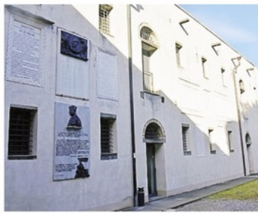
Le lapide sulla facciata dell'ex Casa dei Bombardieri alla Rocca