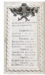
Una delle lapide restaurate

nel 1933 si decide di portare i quattro lapide che erano sotto il loggiato del Palazzo di piazza Vecchia. «Si spostano con i sopraluoghi della memoria della città. Una cosa a cui non siamo più abituati. In quel momento, un gesto simbolico importantissimo. Il Museo, all'apertura, porta con sé parte delle memorie che si erano sedimentate altrove». Antipodo, in qualche mo-