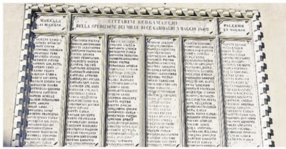
La lapide per i garibaldini bergamaschi partiti con la spedizione dei Mille.