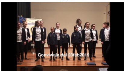
Conviviale del 23feb2019