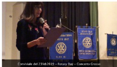
Conviviale del 23feb2019 - Rotary Day - Concerto Grosso

Su proposta del Presidente è possibile scaricare le singole fotografie della conviviale.