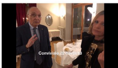
Conviviale 22 nov 2018