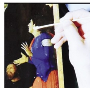
Un dettaglio dell'intervento di pulitura