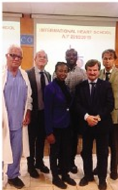
Medici ghanesi accolti dal Rotary

rurgia pediatrica e, dopo aver conseguito il diploma di specializzazione, tornino ad operare nel Paese d'origine. In Africa ogni giorno, muoiono centinaia di bambini a causa di patologie cardiache, bambini che, in presenza di strutture sanitarie e di medici specializzati, potrebbero essere salvati. Questo è stato il motivo che ha spinto due Club così distanti