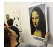
La Gioconda rotante