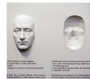
La maschera che ti segue