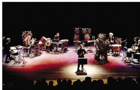
«Les Percussions de Strasbourg» apriranno il Festival Internazionale di Musica per Percussioni «Tam-bu-ri»