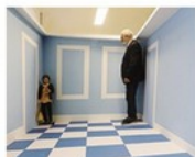
Piccolo e grande: l'inganno