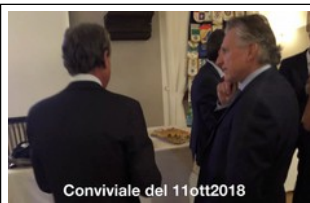
Conviviale del 11ott2018

CLICCA SULLA FOTO PER VEDERE LA RASSEGNA FOTOGRAFICA O IL VIDEO DELLA CONVIVIALE