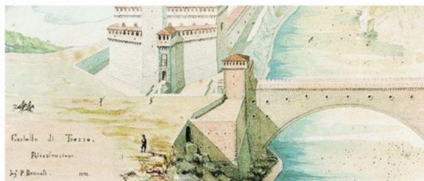
Un disegno dell'antico ponte in mattoni sull'Adda, che dava accesso al Castello di Trezzo

Ponti di grandissime luci si costruivano già nell'800, «main acciaio» spiega ancora Verdina. E non chiamatelo, per favore, «ferro», che si tratti del Ponte di Paderno (1889, ancora in funzione) o della Tour Eiffel.