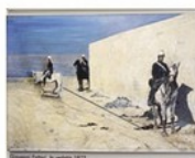
I trucchi della prospettiva