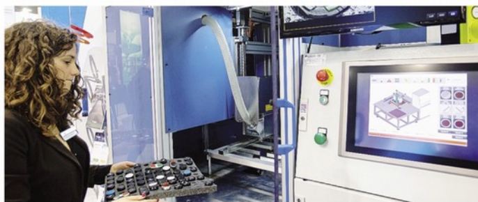
L'intelligenza artificiale applicata alle macchine per produrre protagonista alla Bi-Mu che si è aperta ieri a FieraMilano