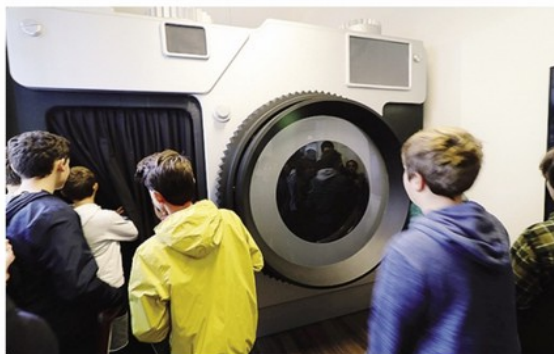
I ragazzi e la grande macchina fotografica attraverso la quale si entra nella mostra FOTO YURI COLLEONI

«Visioni fenomenali» è un percorso interdisciplinare che svela segreti e curiosità in modo semplice e al contempo «fenomenale»: ovvero fenomeni, esperienze, e al tempo stesso anche un po' stupefacciente. La mostra ospita tanti esperimenti, dalla messa a fuoco alle illusioni ottiche, alle alterazioni di prospettiva attraverso giochi fatti di ombre e colori. Nato come rinnova-