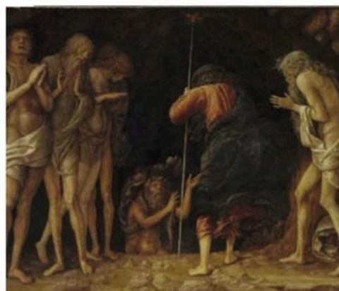
L'opera di Mantegna «Discesa al Limbo» in mostra a Londra

continuiamo a lavorare e vedremo cosa accadrà». Si tratta di convincere l'anonimo collezionista - che si dice sia una facoltosa signora residente in Svizzera - a prestare il dipinto alla Carrara, ma l'opera dopo Londra è attesa alla Gemäldegalerie di Berlino, dove la mostra su Mantegna e Bellini si trasferirà