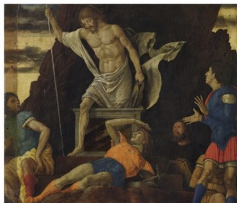
La «Resurrezione» di Mantegna ritrovata in Carrara