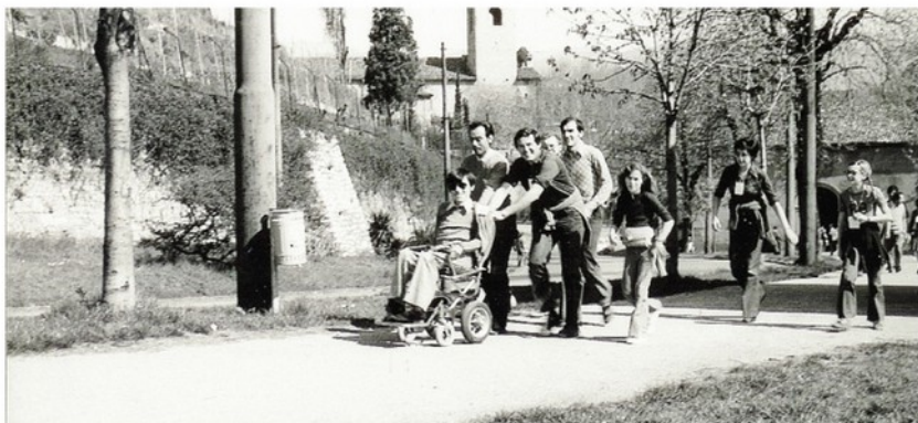
Una delle prime Camminate organizzate dalla Uildm a Bergamo