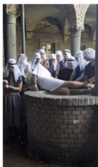
Un'immagine del percorso «Siamo tutti dentro la Bibbia»

I volontari Uildm hanno così provato a far rivivere la Bibbia, innanzitutto imparando a conoscerla attraverso le lezioni di Vertova, e poi provando ad interpretarne alcune scene dell'Antico Testamento. «Il testo biblico è diventato in questo