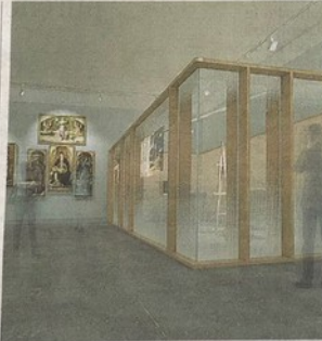
Rendering il padiglione che verrà montato all'Accademia