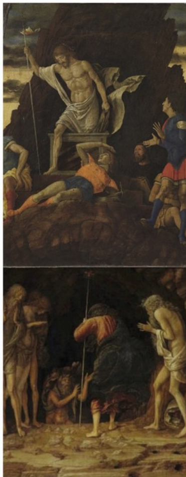
In alto, la «Resurrezione» del Mantegna ritrovata nei mesi scorsi da Giovanni Valagussa nei depositi dell'Accademia Carrara; sotto, la «Discesa al Limbo» comprata all'asta da un acquirente sconosciuto, che verrà esposta in autunno alla National Gallery di Londra; da sola?

Ecco perché la Fondazione Accademia Carrara ancora una volta chiama a raccolta