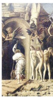
G. Bellini, «Discesa al Limbo»

la mostra londinese, che per la prima volta, attraverso prestiti eccezionali da tutto il mondo esplora il rapporto tra Mantegna e Bellini - in un incrocio lungo tutta una vita, non solo creativo ma anche familiare (Mantegna aveva sposato la sorella di Bellini) - sarà esposta anche l'agognata metà inferiore del nostro Mantegna, messa in dialogo diretto con «La Discesa al Limbo» di Bellini (1475-80, Bristol Museum & Art Gallery). Motivo in più per prendere un volo e visitare la mostra, che si preannuncia davvero straordinaria nell'intrecciare la storia di due artisti, delle loro famiglie e delle loro città.