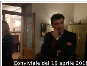
Conviviale del 19 aprile 2018 video