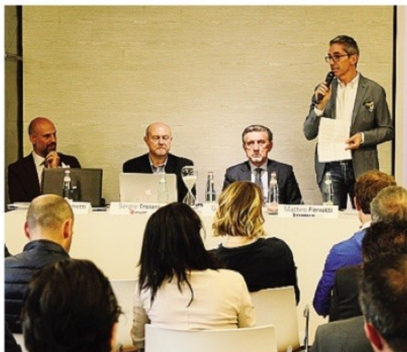
Un momento della presentazione della filiera dell'edilizia