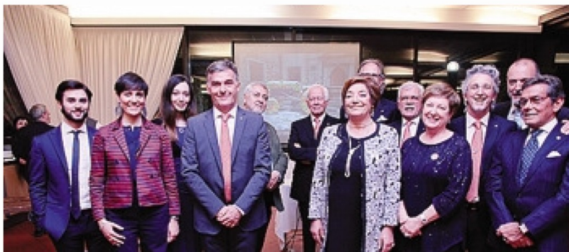
I presidenti dei Rotary promotori

sidente di Atena – e grazie al contributo dei club di servizio adesso sarà possibile portare il laboratorio direttamente nelle scuole o negli oratori. Siamo operativi in numerose scuole secondarie di primo e secondo grado della provincia – continua la presidente di Atena – e quest'anno abbiamo esteso gli interventi anche nelle quinte elementari e avviato un proget-