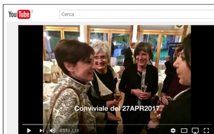
CLICCA SULLA FOTO PER VEDERE LA RASSEGNA FOTOGRAFICA