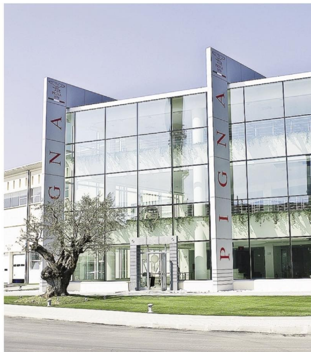
Con la nomina del nuovo consiglio di amministrazione Cartiere Pigna punta al risanamento e al rilancio

Anche per questo le somme investite non sembrano eccessi-