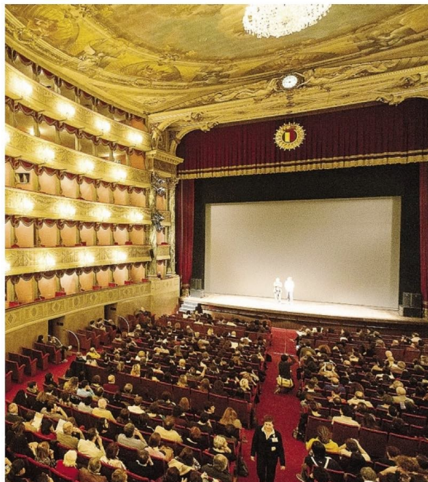
Cantiere in vista per il Teatro Donizetti, che resterà chiuso due anni causa lavori di ristrutturazione.

«Il valore del bando è di 18 milioni. Se vogliamo fare delle opere aggiuntive possiamo preventivare 1,5/2 milioni in più rispetto alle opere previste al bando, opere che comunque garantiranno l'assoluta funzionalità e la ristrutturazione del teatro. Per fare di più e meglio potrebbero volerci altri 2 milioni, ma siamo sulla buona strada nella raccolta dei fondi, che andrà avanti sino a quando il