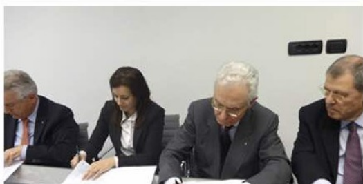
Leggi il testo del Protocollo d'Intesa