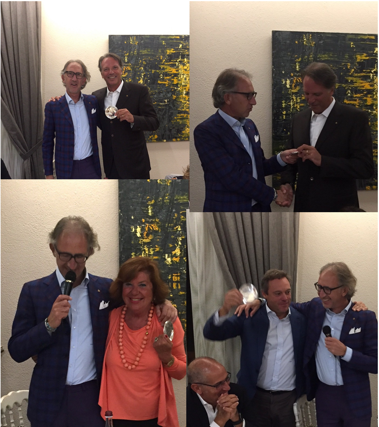
The BEST