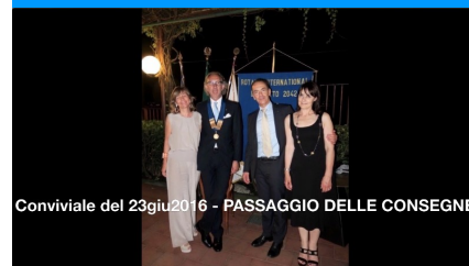
Conviviale del 23giu2016 - PASSAGGIO DELLE CONSEGNE