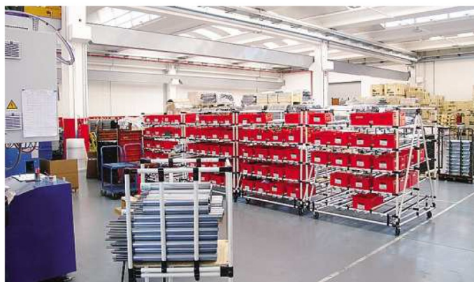
Comincia a riempirsi il nuovo sito produttivo Rulmeca ad Almè, che affianca l'attuale quartier generale

Con un fatturato di circa 142 milioni nel 2015, il gruppo è sempre attivo nella ricerca e sviluppo di nuovi prodotti, costituiti da materiali moderni come i tecnopolimeri, e con una particolare attenzione all'impatto ambientale, un minor utilizzo di energia e spazio, maggior durata e più silenziosità. Alla recente fiera mondiale «CeMAT 2016» per l'intralogistica e la gestione della supply chain, che si è appena tenuta ad Hannover, sono state presentate le innovazioni nel campo dei rulli, mototamburi e «drive roller». Importanti novità si inseriscono infatti nella già vasta gamma produt-