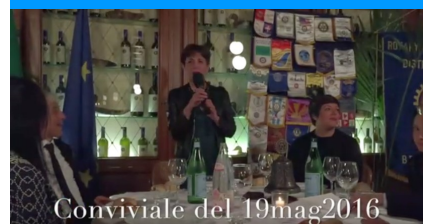
Conviviale del 19mag2016