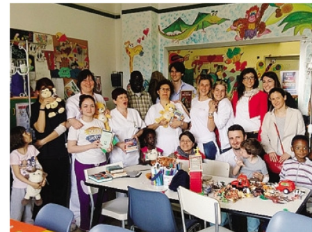
La consegna dei libri alla Pediatria e Neonatologia del San Pietro

Ponte San Pietro La donazione eseguita dalla Zona Orobica del Distretto 2042 Nord Lombardia. «Ora altre collaborazioni»