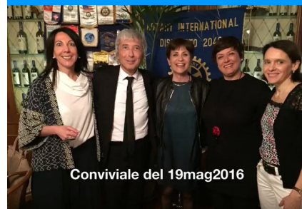
Conviviale del 19mag2016