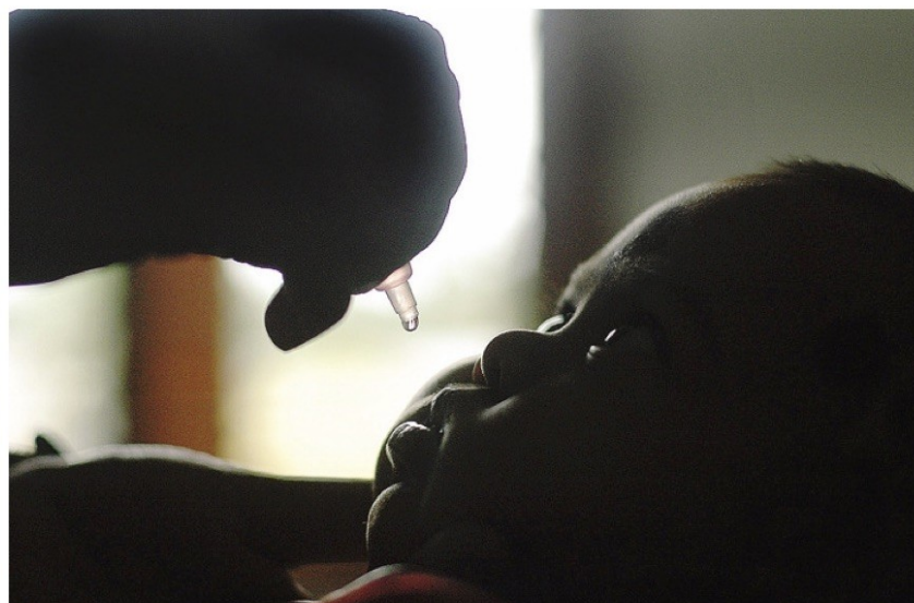
Dal 1979 a oggi sono stati vaccinati due miliardi e mezzo di bambini in tutto il mondo grazie a un progetto partito da Treviglio

E anche la «Fondazione di Bill & Melinda Gates» ha contribuito al progetto, fornendo risorse finanziarie pari a due dollari per ogni dollaro raccolto dal Rotary: facendo due conti, la fondazione ha complessivamente destinato al progetto oltre 500 milioni di