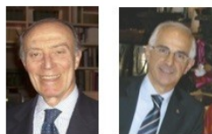
Tutti insieme da Papa Francesco