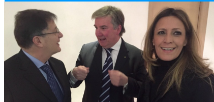
Conviviale del 14gen2016 - Parliamone tra noi