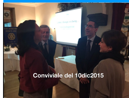
Conviviale del 10dic2015