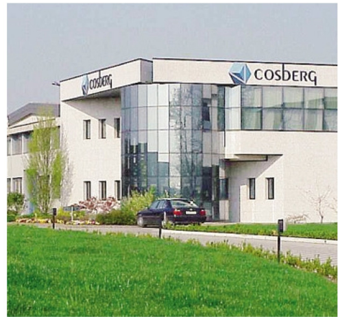
La Cosberg ha sede a Terno d'Isola