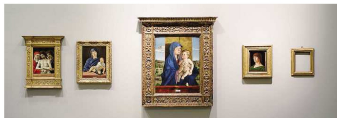
La parete dedicata a Giovanni Bellini. Uno accanto all'altro quattro capolavori assoluti: il Cristo morto con Maria e san Giovanni Evangelista, la Madonna Lochis, la Madonna di Alzano, il Ritratto di giovanotto. Una parete di assoluto valore mondiale.

La nuova Carrara ha energia da vendere, una specie di centrale atomica di arte e storia. Addio vecchia pinacoteca, addio a quell'aria dimessa, bigia e tristezza che per decenni l'ha penalizzata oltre ogni ragionevole limite di pazienza e buon senso. Ogni dettaglio colpisce per il suo rigore. Il colore delle pareti è stato