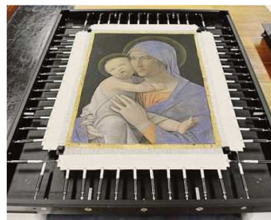
La Madonna del Mantegna senza cornice con il tensionamento a molle

L'intervento si è reso necessario dopo l'intervento di restauro cui è stata sottoposta la tela (34 centimetri di base per 45,5 centimetri di altezza), realizzato dall'Opificio delle pietre dure di Firenze. Nel restauro la tela è stata dotata di un meccanismo con tensionamento a molle, provvisto di dinamometri, che serve appunto a mantenere la tela nella giusta tensione. L'antica cornice non poteva contenere la nuova teca, che è anche a tenuta stagna, con vetro e controllo costante del clima interno. Di qui la decisione di far realizzare una nuova cornice in legno, tentando di riprendere elementi tradizionali di decorazione, anche per scandire una superficie di notevole ampiezza. Il vetro rimarrà. L'opera - una tempera su tela di lino databile all'ulti-