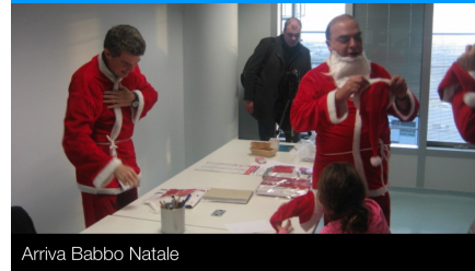
Arriva Babbo Natale