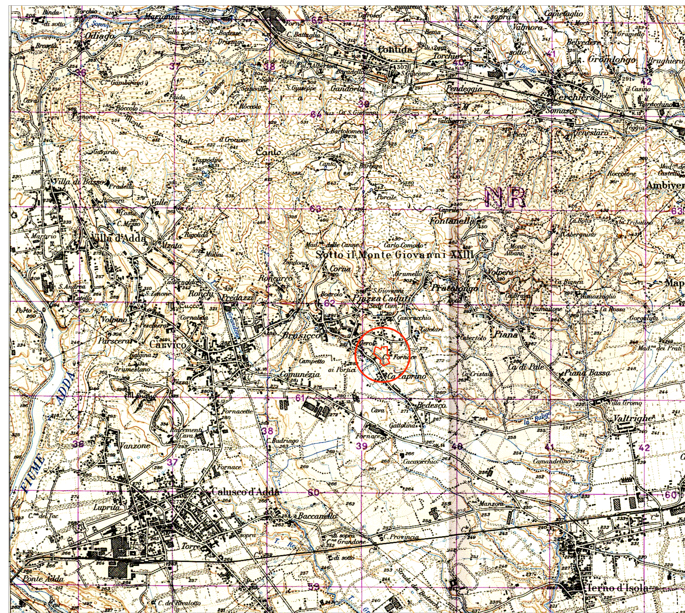
COROGRAFIA - scala 1/25000 -